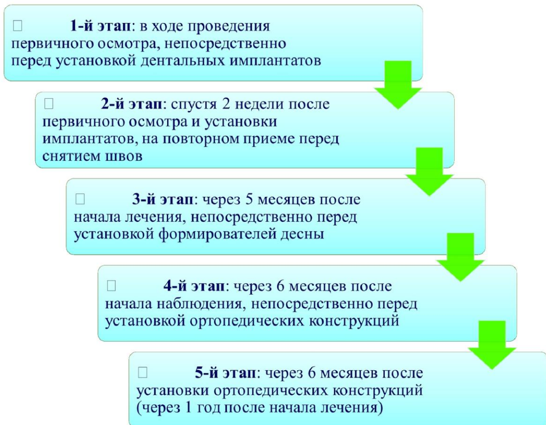
Рисунок 2.1 – Этапы сбора ротовой жидкости больных опытных групп для лабораторных исследований

У испытуемых контрольной группы собирали ротовую жидкость однократно в ходе осмотра. У больных основной группы собирали ротовую жидкость 5 раз (рисунок 2.1).