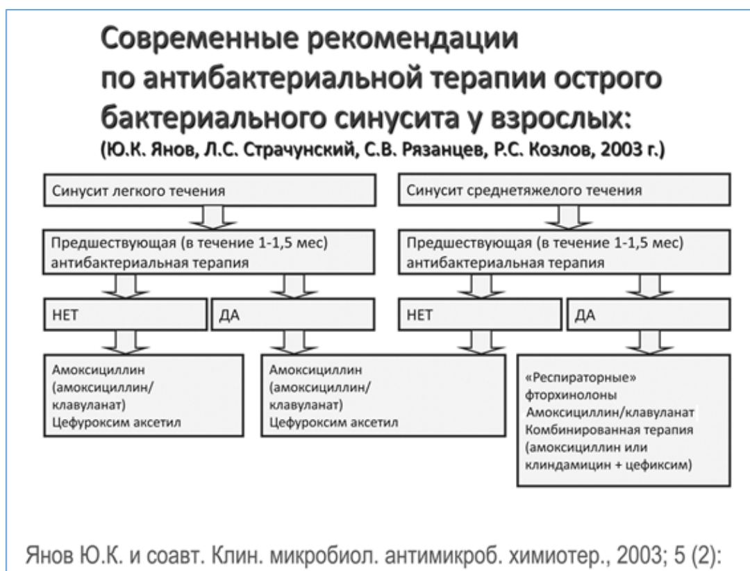
Рисунок 2 - Современные рекомендации по антибактериальной терапии острого бактериального синусита у взрослых [18].

При тяжелом течении острого риносинусита предпочтителен внутримышечный и внутривенный путь введения, целесообразно назначение цефалоспоринов: цефотаксима** или цефтриаксона**. При внутривенном введении используются амоксициллин+клавулановая кислота ** и цефалоспорины. В случае риска анаэробной инфекции – возможно назначение клиндамицина** в комбинации с цефалоспорином (рис. 2).