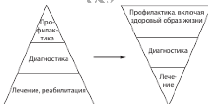
Рисунок 1.1. Перспективы развития системы здравоохранения в области профилактики.

Несмотря на то, что после Н.А. Семашко прошло немало времени, приоритетом государственной политики в РФ остается профилактика заболеваний, пропаганда здорового образа жизни и охрана здоровья. Это связано с тем, что только здоровые граждане способны творчески и экономически развивать страну, создавать условия для выхода России в число передовых мировых держав. Ни одна другая страна мира не характеризуется таким разнообразием географических и климатических зон. Разнообразнейшие экологические факторы, как природного, так и урбанистического характера оказывают прямое и опосредованное влияние на состояние здоровья, поэтому их учитывают при разработке программ охраны здоровья в субъектах РФ. Необходимо отметить, что приоритетность профилактики неоднократно подчеркивалась в выступлениях Президента РФ, Премьер министра РФ, Министра здравоохранения и других высших должностных лиц. Ежегодно возрастает государственное финансирование профилактических программ. Фактически вся система государственной политики в области охраны здоровья граждан направлена на то, чтобы сместить акценты системы здравоохранения от лечения к профилактике (рис. 1.1)