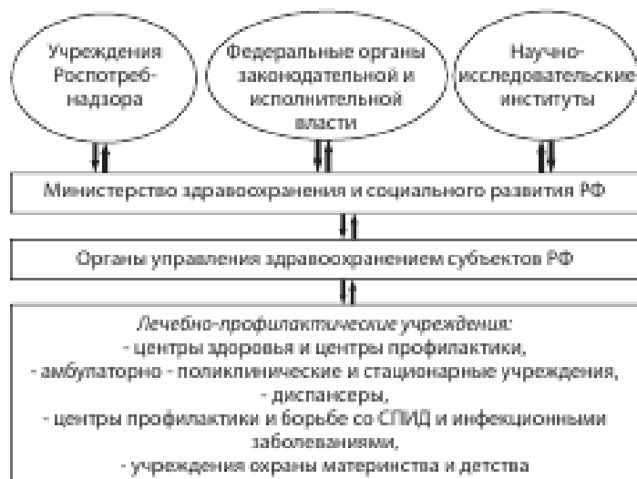
Рисунок 1.2. Принципиальная схема организации системы профилактических мероприятий на территории РФ.

Нормативно-правовая база в области охраны здоровья за последние годы претерпела существенные изменения. Это было связано с тем, что многие законы не менялись со времен СССР, и устарели морально и не могут в полной мере быть реализованы в новых экономических условиях. Проектом концепции развития здравоохранения РФ до 2020 г. предусмотрен приоритет профилактики и охраны здоровья, в частности: