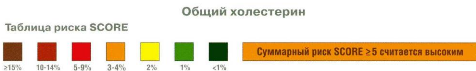
Таблица относительного риска