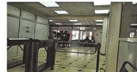
Очередь при заселении