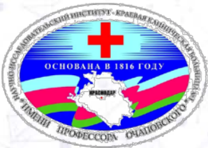
ГБУЗ НИИ-ККБ №1